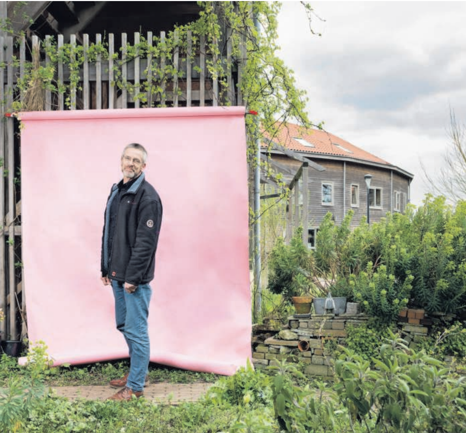
Iwan in Lent (Nijmegen). 'Als je collectieven de ruimte geeft om te bouwen, verdwijnt de winstprikkel.'

'De woningmarkt zit op slot, daar twijfelt niemand aan. Er is een betaalbaarheidsprobleem aan de koopkant, maar ook bij de huur. En er is een zeggenschapsprobleem. Wie huurt, heeft vrijwel niets te zeggen over zijn woning, en behandelt de woning en zijn omgeving daardoor ook vaker als iets wat niet van hem is, wat tot verpaupering en extra kosten leidt. Er is ook nog eens onvoldoende doorstroming. In al die woningen van 100 tot 120 vierkante meter die sinds de jaren zeventig aan de rand van steden en in groeisteden zijn gebouwd, wonen veel te weinig mensen. Kinderen zijn uitgevlogen, partners zijn overleden, mensen zijn gescheiden. Maar wie achterblijft, verroert zich niet. Die zal wel gek zijn om zo'n riant en goedkope woning te verlaten.